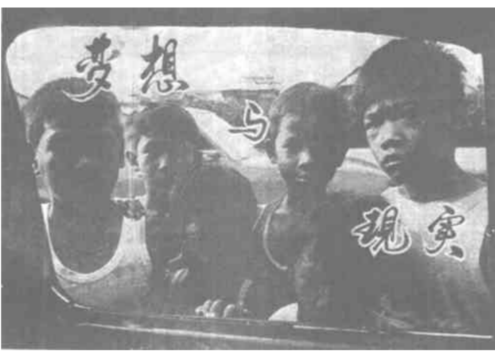
图为菲律宾马尼拉一群“街头儿童”

分类回收 循环利用 “看来，废弃物分类回收、循环利用正在被证明是一种可行的选择”，对垃圾处理有不少著述的伦敦垃圾管理局负责人库伯先生对记者说。