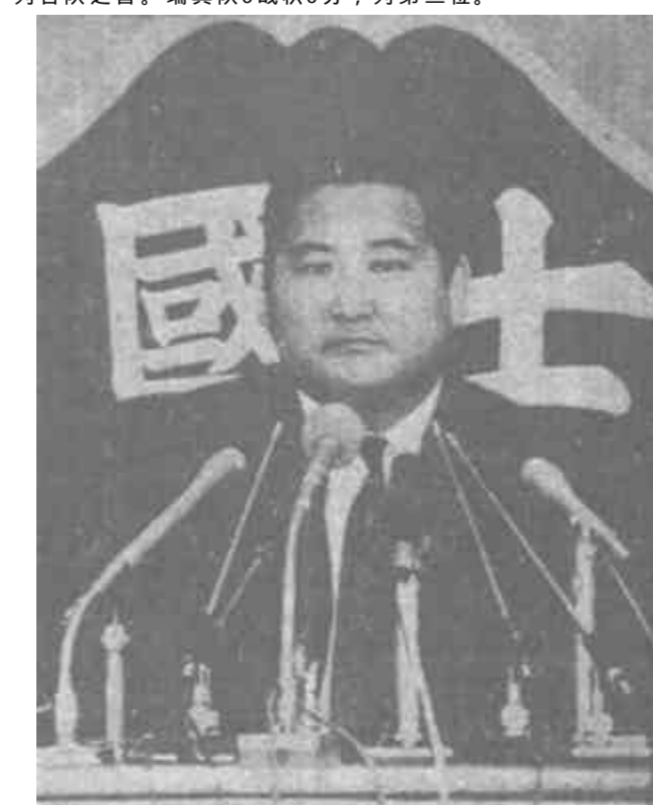
日本柔道名将斋藤仁退役

这是1990年世界杯足球赛预选赛欧洲区第二组的比赛。英格兰队上半场进了两球。目前，英格兰队在该组赛过4场比赛，以积7分的战绩名列各队之首。瑞典队3战积5分，列第二位。