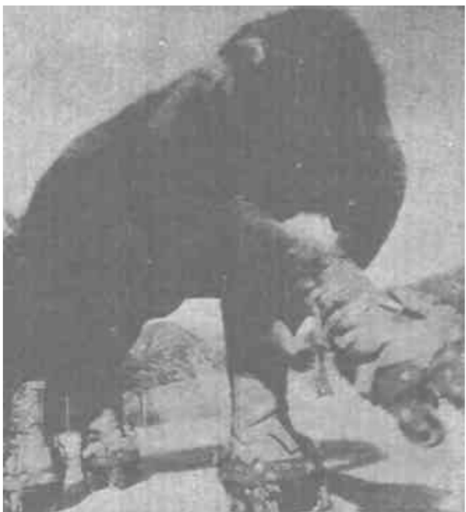
印度的大象以聪明、能干闻名于世。这位穿上旱冰鞋的“先生”，正在溜冰场上大显风采。