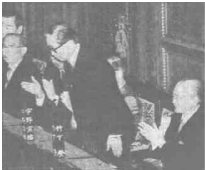
6月2日，在日本文学馆举行的全体会议上，外相宇野(右二)当选日本首相。

这项打击刑事犯罪的新方案是布什在华盛顿国会外的群众集会上宣布的。布什同时还接见了在执勤中受伤的警官。