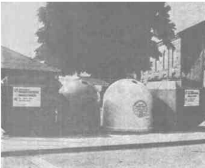
图为伦敦街头的分类垃圾箱

为了这次选美，墨西哥政府投资改善了坎昆的卫星通讯条件，私人旅店集团投资改善了旅游设施。墨西哥旅游当局有信心地认为，大约有6亿人通过电视观看了坎昆选美，了解了坎昆，这将成为坎昆的潜在的巨大客源。